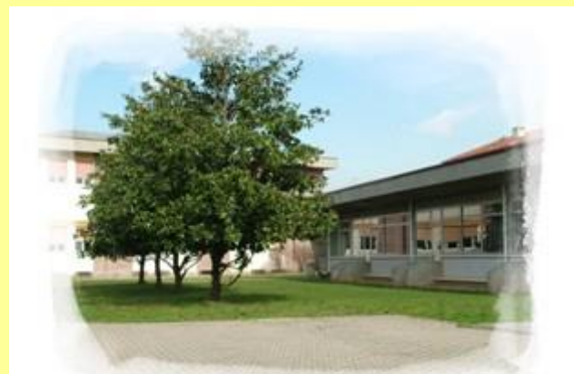
Scuola Primaria "C. Battisti" - Oggiona