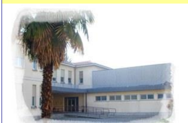
Scuola Primaria "Gen. Cantore" - S.Stefano