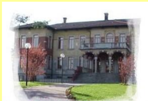
Scuola Primaria "E. Fermi" - Carnago

Carnago - Oggiona con Santo Stefano - Solbiate Arno